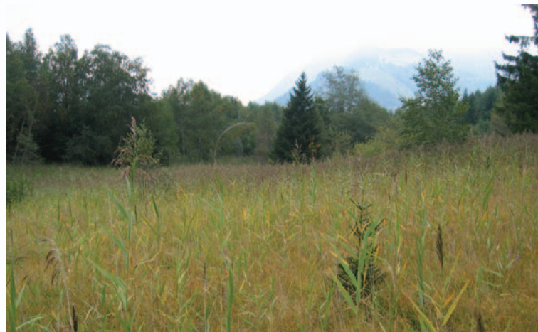
Das Zalum-Ried: ein äusserst wertvoller ökologischer Lebensraum, leider durch fehlende Bewirtschaftung bedroht. Zalum-Ried: an extremely precious ecologic living area, threatened by the lack of management.

Die Durchführung obliegt dem Umweltausschuss der Marktgemeinde Nenzing mit externen Beratern. Bei der Umsetzung von diversen Projekten sollen die Bevölkerung, als auch verschiedene Vereine mit einbezogen werden. Dadurch soll gewährleistet sein, dass viele Flächen und Biotope zum einen, als auch Streuwiesen und Wälder nachhaltig auf mehrere Jahre rekultiviert und verbessert werden.